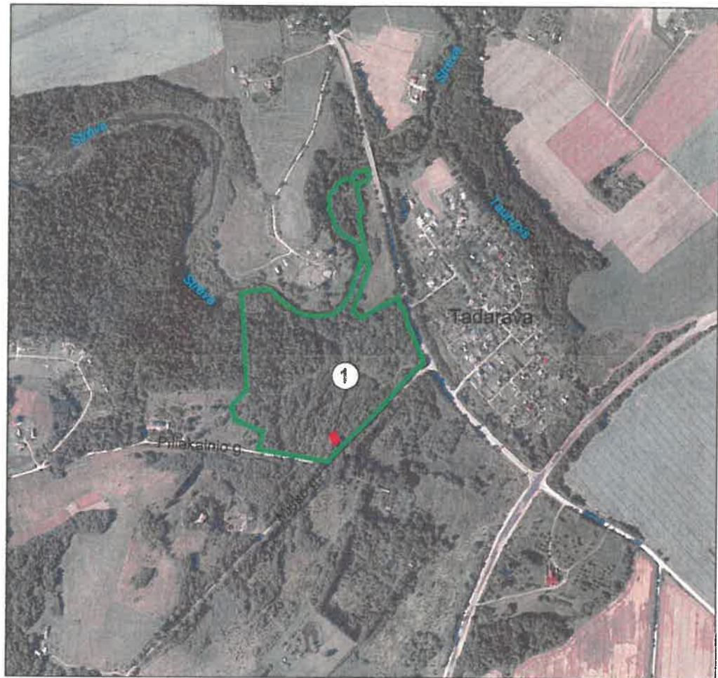
M 1 : 10 000 (vienne cm - 100 m)

Tadaravos k., Kruonio sen., Kaišiadorių r. sav.